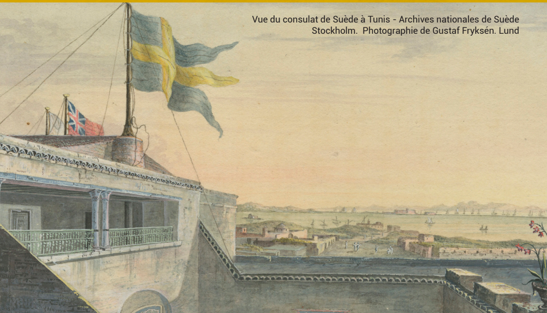
Vue du consulat de Suède à Tunis