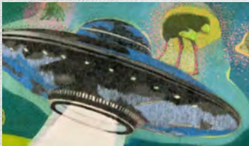
Fragment, Eya Ben Amor

Une exposition collective d'artistes émergents de Sousse et de la région, proposant leur regard singulier à l'aide de différents supports (vidéo, peinture, photographie, sculpture, installations...). Commissaires : Karim Sghaier, Amira Zili et IF Sousse.